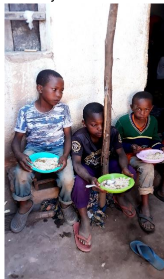
Eten bij circustraining